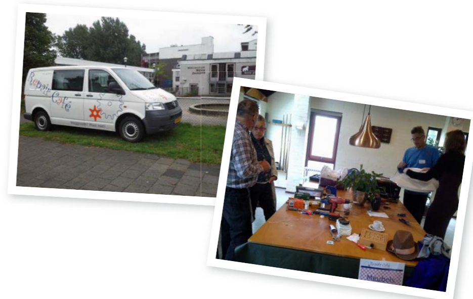
Repair Café Hilversum ging in september van start

Wegens het enorme beroep dat in 2013 op de bus werd gedaan, heeft Stichting Repair Café in de zomer besloten om de bus niet langer gratis op pad te sturen. Aan lokale organisatoren werd vanaf augustus een eigen bijdrage van € 150 gevraagd. Hierdoor is het aantal aanvragen, dat in het voorjaar de spuigaten uitliep, na de zomer afgenomen. Toch zijn in de tweede helft van het jaar nog altijd 11 ritten uitgevoerd.