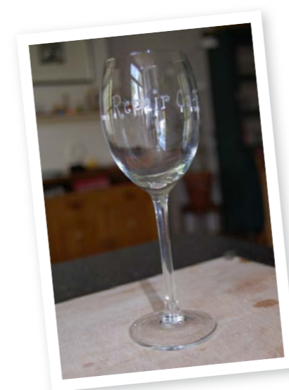
De organisatoren van Repair Café Vorden gaven alle betrokkenen tijdens hun eerste Repair Café een wijnglas met het Repair Café-logo erin gegraveerd. Daarmee werd vervolgens geproost.