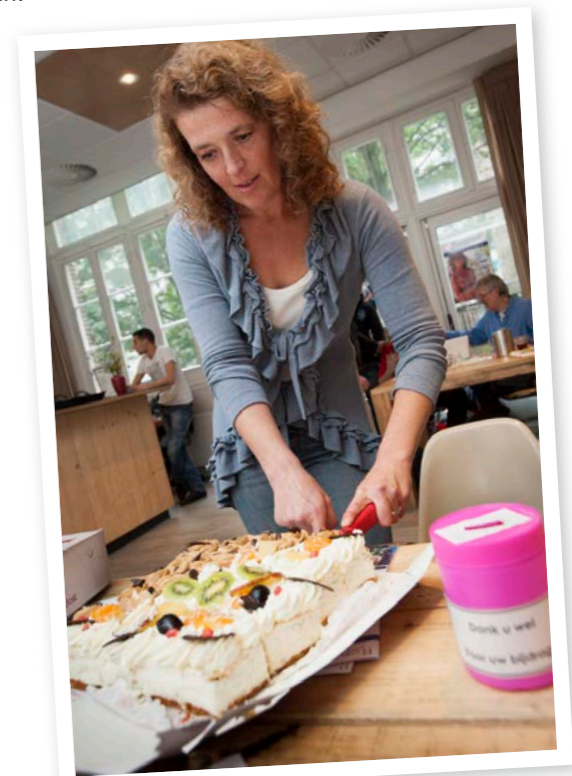
Taart in Repair Café Amsterdam-Oost: 275 Repair Cafés wereldwijd!

Half oktober trakteerde Stichting Repair Café, in het eigen Repair Café in Amsterdam-Oost, op taart. Daarmee wilde de stichting markeren dat Nederland op dat moment 160 Repair Café-locaties telde en dat er wereldwijd al 275 groepen actief waren.