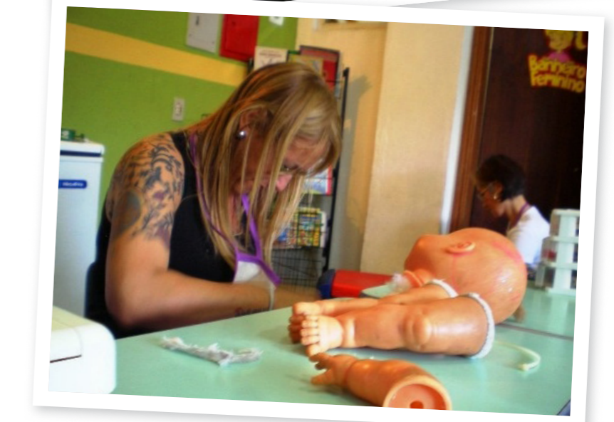
In Brazilië is de Repair Café-sfeer precies hetzelfde als in Nederland