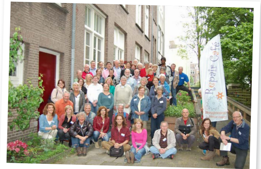
Landelijke Repair Café-dag in Amsterdam-Oost

Voor deze dag, die Stichting Repair Café op zaterdag 1 juni organiseerde, kwamen ruim zeventig organisatoren van bijna veertig Repair Cafés naar Amsterdam. In Buurtcentrum De Meevaart, thuisbasis van Repair Café Amsterdam-Oost, werden speeddate -sessies en groepsgesprekken gehouden en werd gezamenlijk geluncht. De hele dag hadden de Repair Café-organisatoren gelegenheid om kennis met elkaar te maken, ervaringen uit te wisselen en van elkaar te leren. De dag werd afgesloten met een groepsfoto in de tuin van De Meevaart.